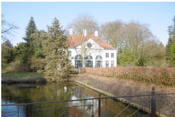
Orangerie Hof ter Saksen begin 21 ste eeuw